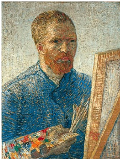
Van Gogh Autoportrait à la palette

Seule l' expérience esthétique nous permettra d'échapper à la « désinvolture » et à la « légèreté » d'une pensée qui n'est plus qu'une « pensée de survol ». Là réside pour Merleau-Ponty la vocation de l'art, surtout de la peinture. Le regard du peintre possède le pouvoir de réveiller en nous le souci de la beauté et de nous aider à retrouver cette vision magique et dévorante , nous ouvrant ainsi au « talisman » du monde . Alors le monde, retrouvant sa chair et sa densité, n'est plus devant nous pure représentation , mais s'offre à nous dans une sorte de co-présence «où notre cerveau et l'univers se rejoignent» selon une formule de peintre Cézanne.