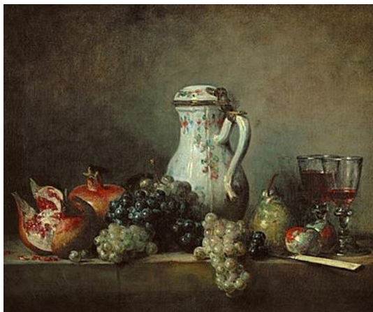
Jean-Baptiste Chardin Raisin et grenades

L' esthétique moderne , avec Kant ou Schiller, a fortement noué ce lien . Ainsi Kant affirme-t-il dans sa Critique de la faculté de juger « L'agréable vaut aussi pour des animaux privés de raison; la beauté seulement pour des hommes ». L' agréable a une valeur pour l' animal . L'animal, par exemple, est préoccupé par la recherche de la nourriture ou celle du partenaire sexuel qui lui permettra de satisfaire ses instincts vitaux . Mais il reste indifférent à la beauté . Ainsi ne regardera-t-il pas le bleu du ciel parce que celui-ci n'est pas comestible. L' homme , par contre, est capable – même s'il a faim et soif – de s'arrêter devant une nature morte et de se plonger dans sa contemplation , tout en sachant qu'il ne pourra pas goûter les fruits du compotier ni savourer le verre de vin représentés sur le tableau .