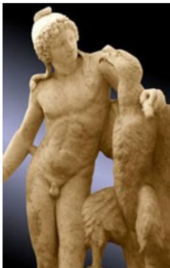
Zeus et Ganymède

Tout jeune grec de bonne naissance se devait de travailler à cet idéal complet de réalisation de soi connu sous le nom de kalos kagathos . Il s'agissait de former simultanément le corps et l' âme , alliant ainsi le développement physique harmonieux à l' excellence sur le plan moral . Fervent admirateur de la Grèce ancienne, Nietzsche souligne à plusieurs reprises combien le primat d'une telle préoccupation exigeait d' efforts , de discipline et de contrainte de la part de l'homme grec. « A Athènes (...) les hommes et les jeunes gens étaient de beaucoup supérieurs en beauté aux femmes: mais aussi quel travail et quel effort au service de la beauté le sexe mâle avait exigé de lui-même depuis des siècles! » ( Crépuscule des idoles ). Cette totale subordination de leur existence au beau n'était réalisable que parce que les Grecs, n'ayant pas à gagner leur vie, disposaient du loisir suffisant à la réalisation de cette tâche.