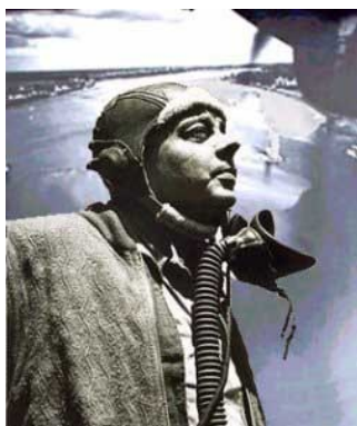
Antoine de Saint-Exupéry

Ce nouvel humanisme s'illustre dans la figure de celui que Merleau-Ponty, dans un article de Sens et non-sens nomme le héros des contemporains . Certes, « le culte des héros est de tous les temps ». Mais le tragique de l' héroïsme d'aujourd'hui , c'est qu'il ne peut plus trouver sa justification dans des valeurs transcendantes , Providence divine ou lois de l'histoire. « Le héros des contemporains(...) a l'expérience du hasard, du désordre et de l'échec(...). Il est dans un temps où les devoirs et les tâches sont obscurs (...). Tout bien considéré, rien n'est sûr ». Il n'y a plus d' absolu . Dans un monde qui se disloque et qui titube , le héros ne peut éviter l' hésitation et les questions au moment de se lancer dans l' action . Car il sait que son combat n'est pas gagné d'avance « dans le ciel ou dans l'histoire ». Et pourtant, le héros des contemporains accepte une mission qu'il se sent tenu d'accomplir . Les tâches qu'il invoque sont alors le courage et la fidélité . Ainsi Saint-Exupéry , sommé d'exécuter une mission sur Arras en juin 40, alors que les soldats français ne pouvaient plus rien contre les panzers allemands qui s'y étaient rassemblés, se jette cependant au devant du danger , affrontant le feu de la D.C.A., « parce qu'il ne serait plus rien s'il se dérobait ».