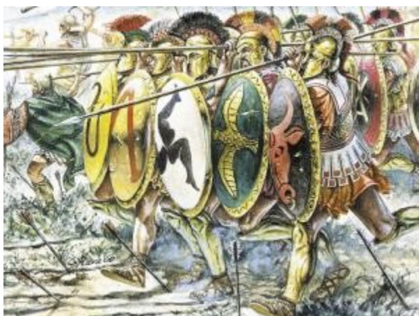
La phalange grecque

A l'inverse, jeter son bouclier et abandonner ses compagnons de combat est l' acte le plus déshonorant pour le soldat, le symbole même de la lâcheté ; jeter son bouclier, c'est agir injustement . Une telle caractérisation de l'action lâche et de l'action courageuse évoque bien la pratique des cités grecques à l' âge classique . Le combat n'y est plus, comme au temps d'Homère, axé sur des hauts faits individuels , il est devenu collectif . Dans la phalange , tous les hoplites combattent sur le même rang . Le bouclier devient alors l' indispensable instrument de cohésion . Laisser tomber son bouclier, c'est briser le rang , trahir la solidarité indispensable de la phalange .