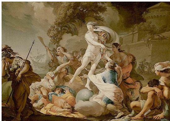
La fortune aveugle

Telle est la leçon que le philosophe existentialiste reconnaît avoir tirée de la lecture de ce grand théoricien de l'action politique que fut Machiavel ( Note sur Machiavel ). Machiavel en effet évoque à plusieurs reprises l'idée d'un « hasard fondamental » et d'une « adversité » auxquels se confronte inévitablement l' action des hommes. Les hommes agissent toujours dans un cadre ou dans des circonstances qui ne peuvent être contrôlés et leur échappent . A ces conditions objectives de l' action politique , Machiavel a donné le nom de fortune . La fortune désigne le cours aléatoire du monde, et aussi la force du hasard qui fait advenir des événements imprévisibles, le plus souvent nuisibles à l'homme. Versatile, inconstante, « elle nous élève, nous renverse sans pitié, sans loi et sans raison ». Au chapitre XXV du Prince , Machiavel la compare à un cours d'eau impétueux qui emporte tout sur son passage. Le succès d'une action , même la plus intelligente et la plus audacieuse, n'est donc jamais entièrement garanti , parce qu'il n'est pas à l'abri des caprices et des revirements de la fortune . En témoigne l' exemple de César Borgia, longuement relaté au chapitre VII du Prince . Son échec final ne peut être imputé qu'à ces hasards que furent la mort du Pape Alexandre VI et sa propre maladie .